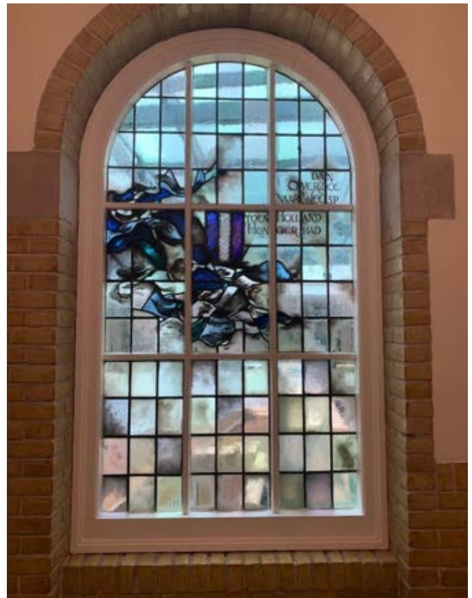
Figuur 6 een van de drie ramen geschonken door Weesp aan de gemeente Bolsward