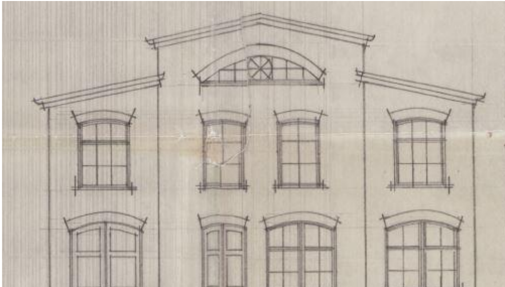
Figuur 5 pand singel 7-9

De familie van mijn moeder wisten nog niet dat haar vader was overleden. Het was de bevrijding, en de Canadezen waren er. En mijn mem en mijn beppe, die zaten te wachten, zou heit ook nog komen. Op een gegeven moment komt er een motor met zeispan en daarin zat een omke zegger van mijn pake die zei " mouike, omke komt net meer, want we ha heard dat hij is omkommen yn e Eastzee" en toen was het rouwen. Mijn mem was echt het lievelingetje, en ze sprak altijd met veel genoeg over haar vader.