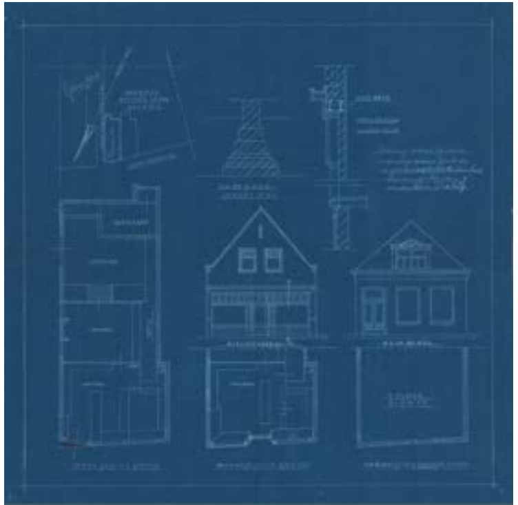
Figuur 8 kruidenierszaak van den Berg

We zijn woensdag van het licht afgesloten, maar zitten nu bij een clandestien aangelegd pitje. De meeste Duitsers zijn vannacht weggegaan, waarschijnlijk naar het front. Van dat fietsverbod hebben we nog niets gemerkt. Mijn vader heeft een vrijstelling voor het fietsen gekregen.