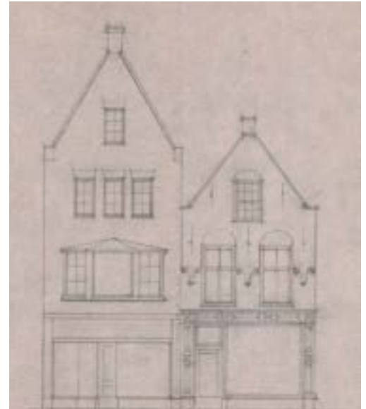
Figuur 4 rechts Suupmarkt 10 te Sneek

In januari 1945 bereidde de verzetsgroep een overval op het politiebureau aan het Martiniplein in Sneek voor. Politieerman Brouwer, lid van de verzetsgroep, zou vroeg in de ochtend op een bepaalde tijd de deur open zetten, waarna de groep het overige politiepersoneel zou overmeesteren en de gevangenvellen zou openen. De eerste keer ging de actie niet door: de hele groep had de nacht doorgebracht aan de Suupmarkt 10. Op weg naar het Martiniplein werden zij gewaarschuwd: de