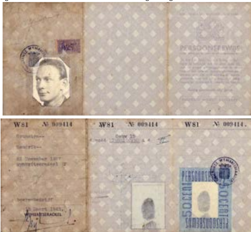
Figuur 3 Vals persoonsbewijs Freerk Leenstra

Hij is in drie dagen uiteindelijk thuisgekomen. Onderweg 'logeerden' ze in boerenschuren, wat niet zonder gevaar was. Sommige boeren waren namelijk niet te vertrouwen doordat ze voor de Duitsers waren en bij de NSB zaten. Eerder waren er bij een vluchtpoging twee gevangenen doodgeschoten, dus het was nog wel riskant. Maar Freerk Leenstra komt gelukkig weer heelhuids thuis.